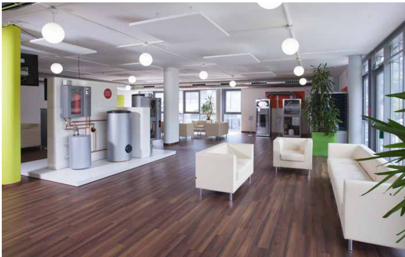
Schulungszentrum in Kasendorf

Unser Trainingscenter in Kasendorf bietet die perfekte Möglichkeit, Trainings vom grundlegenden Umgang mit Wärmepumpen bis hin zum Verständnis technischer Details direkt vor Ort durchzuführen. Gerne können Sie während einer Werksführung weitere Blicke hinter die Kulissen werfen.