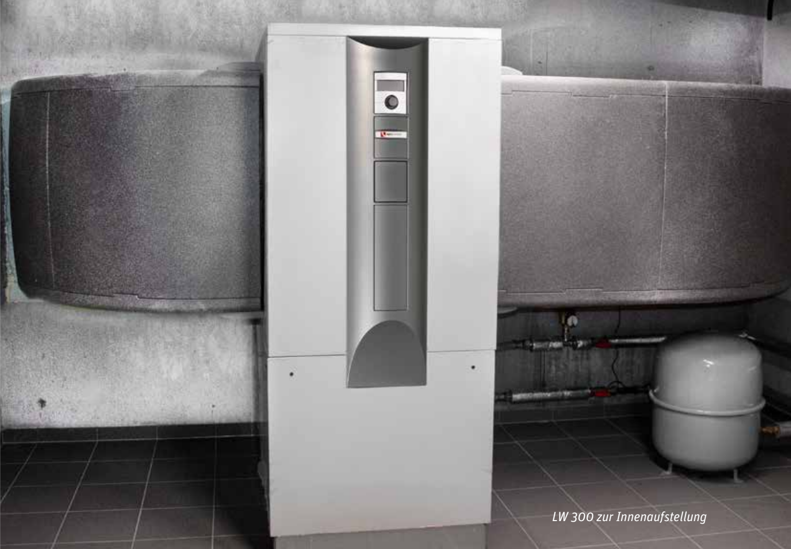
LW 300 zur Innenaufstellung