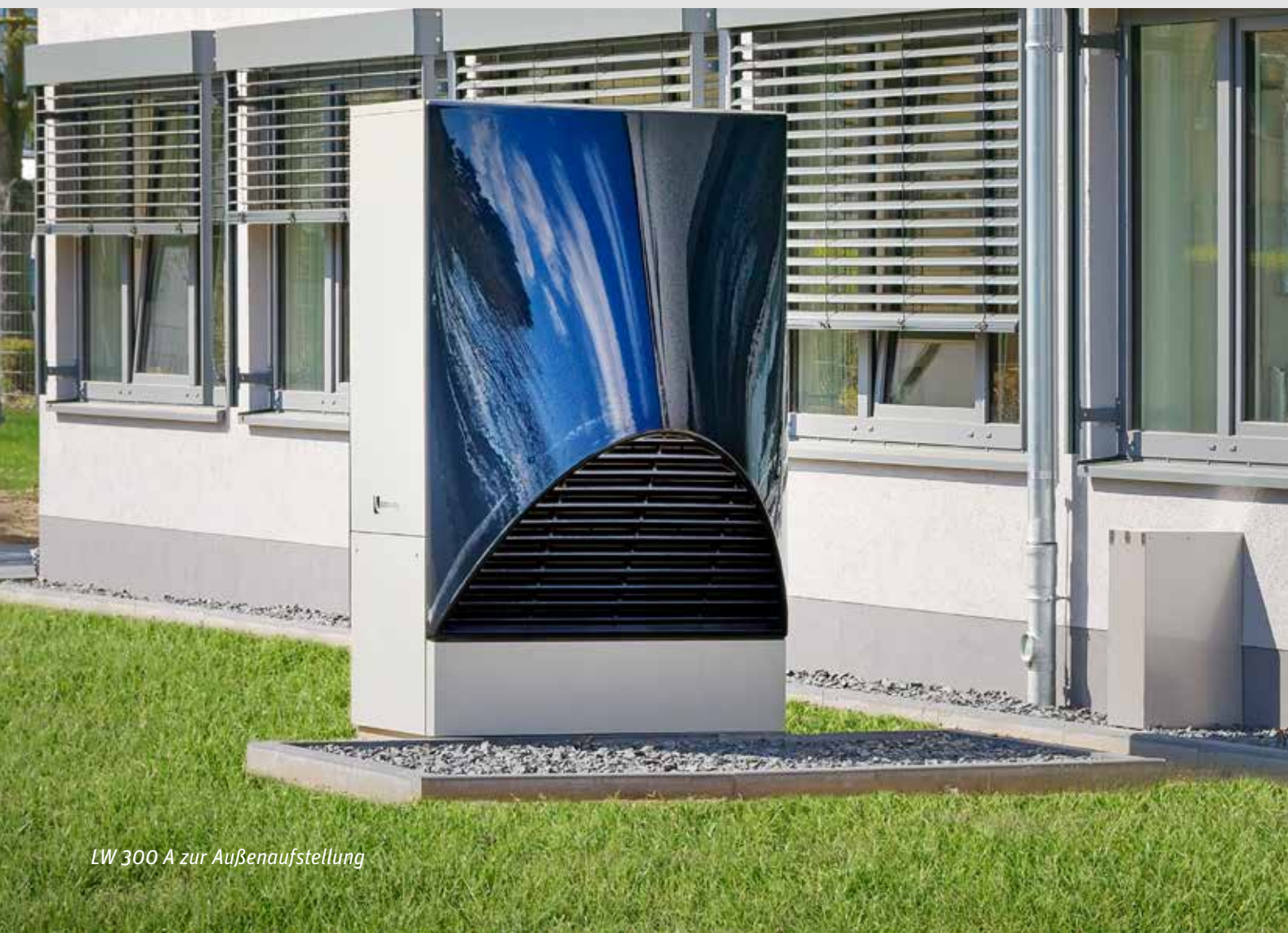
LW 300 A zur Außenanstellung