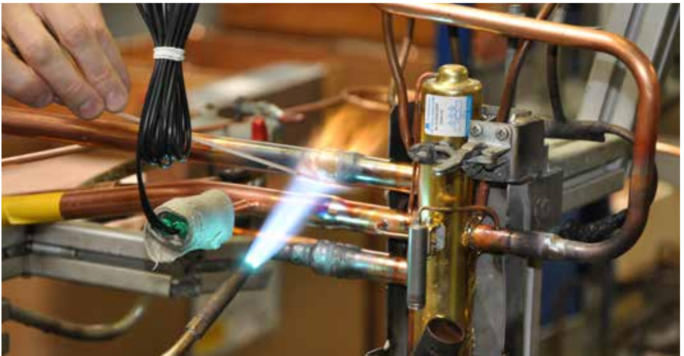
Trainingscenter in Kasendorf

Unser Trainingscenter in Kasendorf bietet die perfekte Möglichkeit, Trainings vom grundlegenden Umgang mit Wärmepumpen bis hin zum Verständnis technischer Details direkt vor Ort durchzuführen. Gerne können Sie während einer Werksführung weitere Blicke hinter die Kulissen werfen.