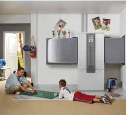
Luft/Wasser-Wärmepumpe Innen 25 kW (LW 251)