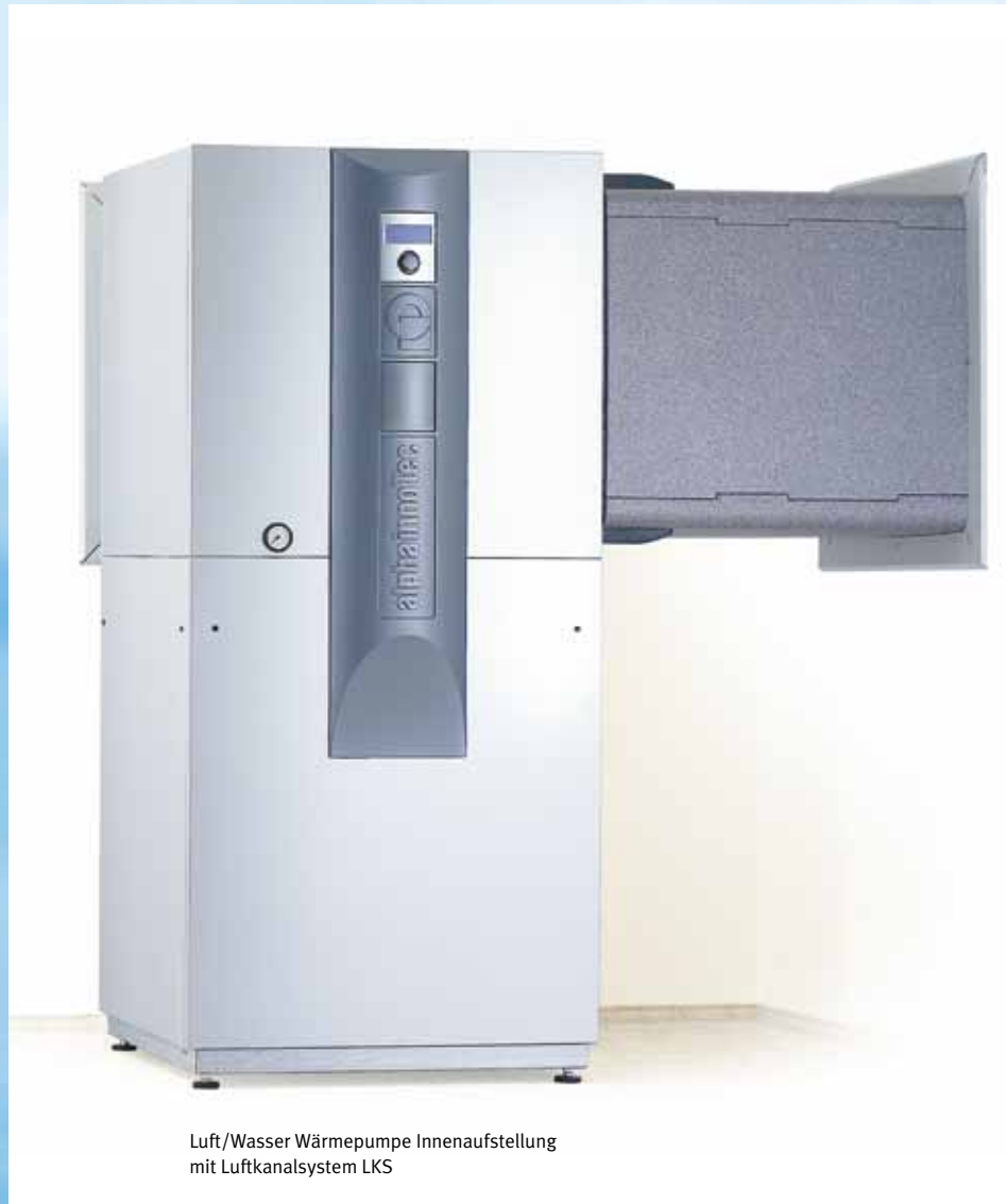
Luft/Wasser Wärmepumpe Innenaufstellung mit Luftkanalsystem LKS

In wenigen Schritten ist der Aufbau erledigt