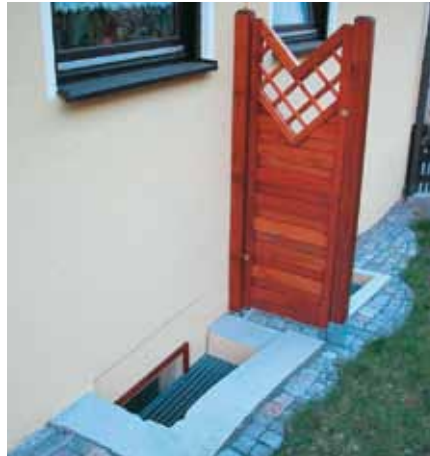
Beispiel lufttechnische Trennung