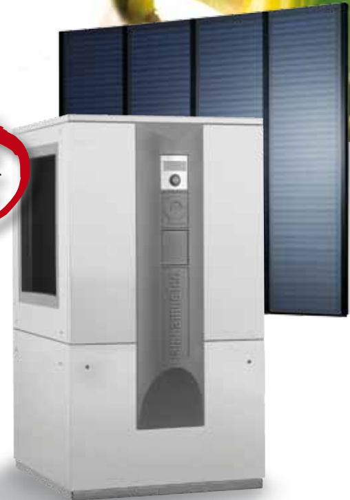
LW 90 Solar

AlphaWeb fähig Regeln Sie Ihre Wärmepumpe doch einfach am Computer!